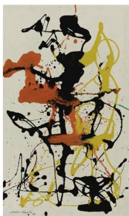
Džeksons Poloks, Nr.26 (1949)