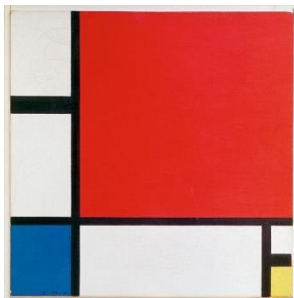
Pīts Mondriāns, Kompozīcija Nr.2 sarkanā, zilā un dzeltenā (1930)

Ģeometriskā abstrakcionisma un abstraktā ekspresionisma piemēri