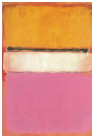
Marks Rotko, „Baltais centrs” (1950)

Saites ar vizuālu uzskates materiālu abstrakcionisma glezniecības tehnikās: